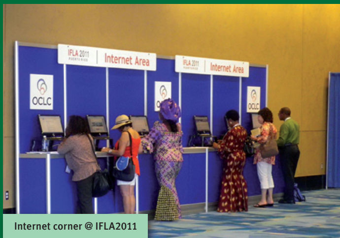
Internet corner @ IFLA2011