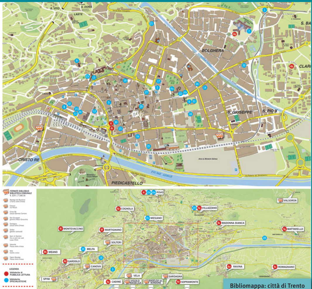
Bibliomappa: città di Trento