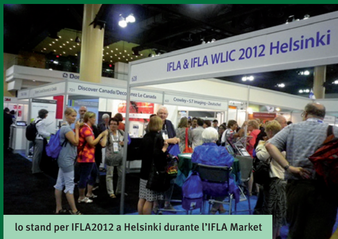
Lo stand per IFLA2012 a Helsinki durante l'IFLA Market

professionale per la catalogazione e quello personale per l’architettura e l’ecosostenibilità.