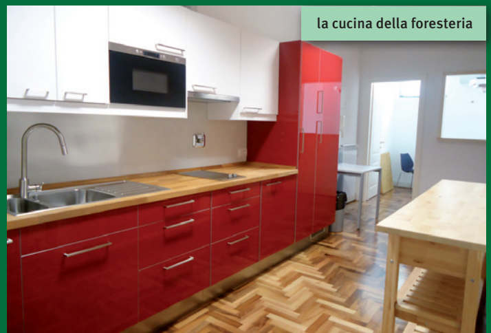
la cucina della foresteria

o Case del Traduttore europei (in tutto ad oggi 13) che promuovono il perfezionamento dei traduttori letterari e la qualità delle opere tradotte mettendo a disposizione alloggi e risorse. Queste "Case" hanno dato vita alla rete RECIT (Réseau Européen des Centres Internationaux de Traducteurs littéraires, http://www.re-cit.eu/ ), ovvero una rete europea di centri di traduzione letteraria che offrono residenze ai traduttori e che creano momenti di confronto tra traduttori, scrittori e, in generale, professionisti