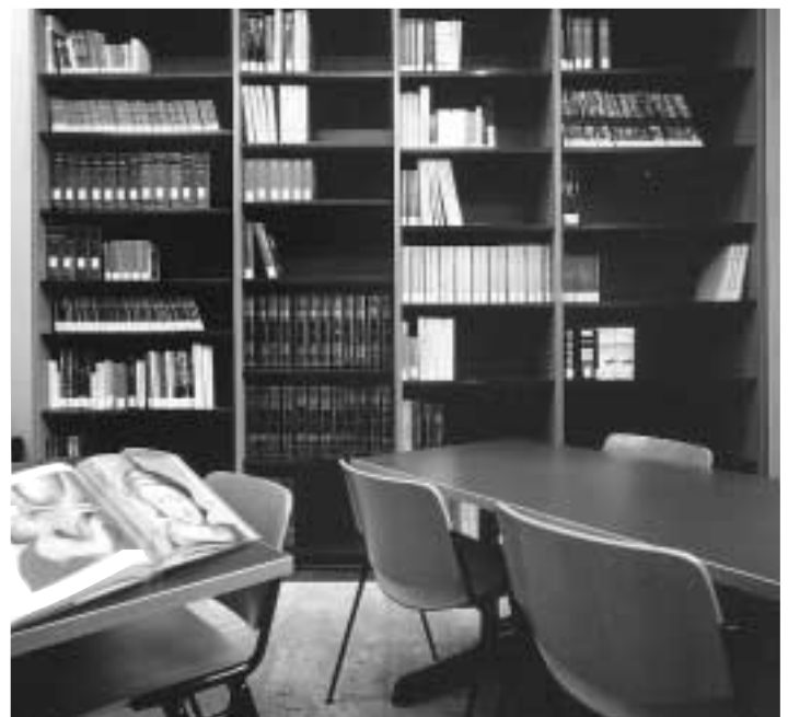
La sala di consultazione