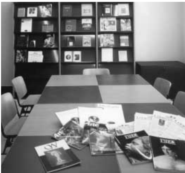
La sala riviste

In questa occasione sono state consegnate alcune tessere onorarie della Biblioteca ai donatori che hanno incrementato il patrimonio artistico e librario della città.