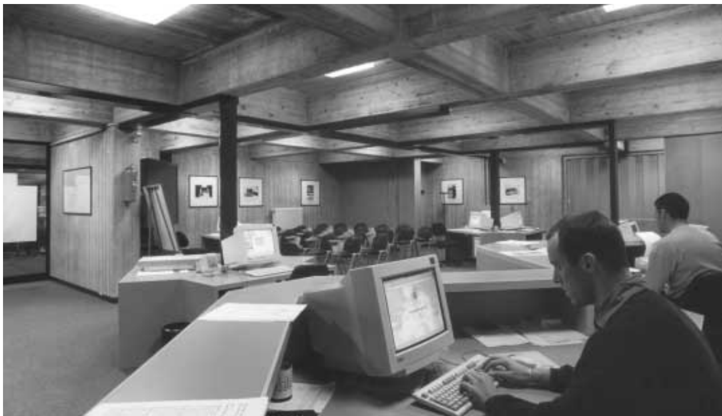
Utenti alle postazioni nella sala della biblioteca virtuale

Ecco perchè l'aggettivo virtuale , così di moda adesso, è affascinante ma improprio: da un lato ci sono gli strumenti informatici, con la loro talvolta ingombrante fisicità, lo spazio fisico in cui ci si incontra, dove si chiedono e si danno informazioni, dove il bibliotecario funge da mediatore e opera di concerto con l'insostituibile supporto dell'informatico, dall'altro lo spazio impalpabile del flusso d'immagini, suoni e testi dell'iperspazio. Il tutto cercando di mettere in pratica quel concetto di friendship , tanto di moda adesso, che richiama quell'immagine di biblioteca amichevole delineata ad un recente congresso sull'argomento.