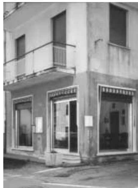
La sede del Centro Culturale

Montoggio è divenuta così sede di ricerche storiche: i Fieschi in primo luogo e ripetutamente, sino al quaderno curato dal C. insieme col Comune, Il castello di Montoggio , di D. Calcano, Chiavari 1999; casate liguri influenti, Doria, Spinola, Grimaldi ecc.; la storia di Balilla e vertenze relative alle origini di G.B. Perasso; gli anni cruciali del nostro Risorgimento; letture della seconda guerra mondiale: tutte con rinnovati fruttuosi elementi d'archivio, in collaborazione con l'Accademia Ligure di Scienze e Lettere (presidenza A. Obertello, poi L. Brian; memorie edite ininterrottamente negli Atti dal 1981 e nelle Colonne di Monografie e Studi e Ricerche ); con l'Accademia Ligustica di Belle Arti, con l'Università di Genova, con le istituzioni di zona (Consulta Ligure, Comunità Montana della Valle