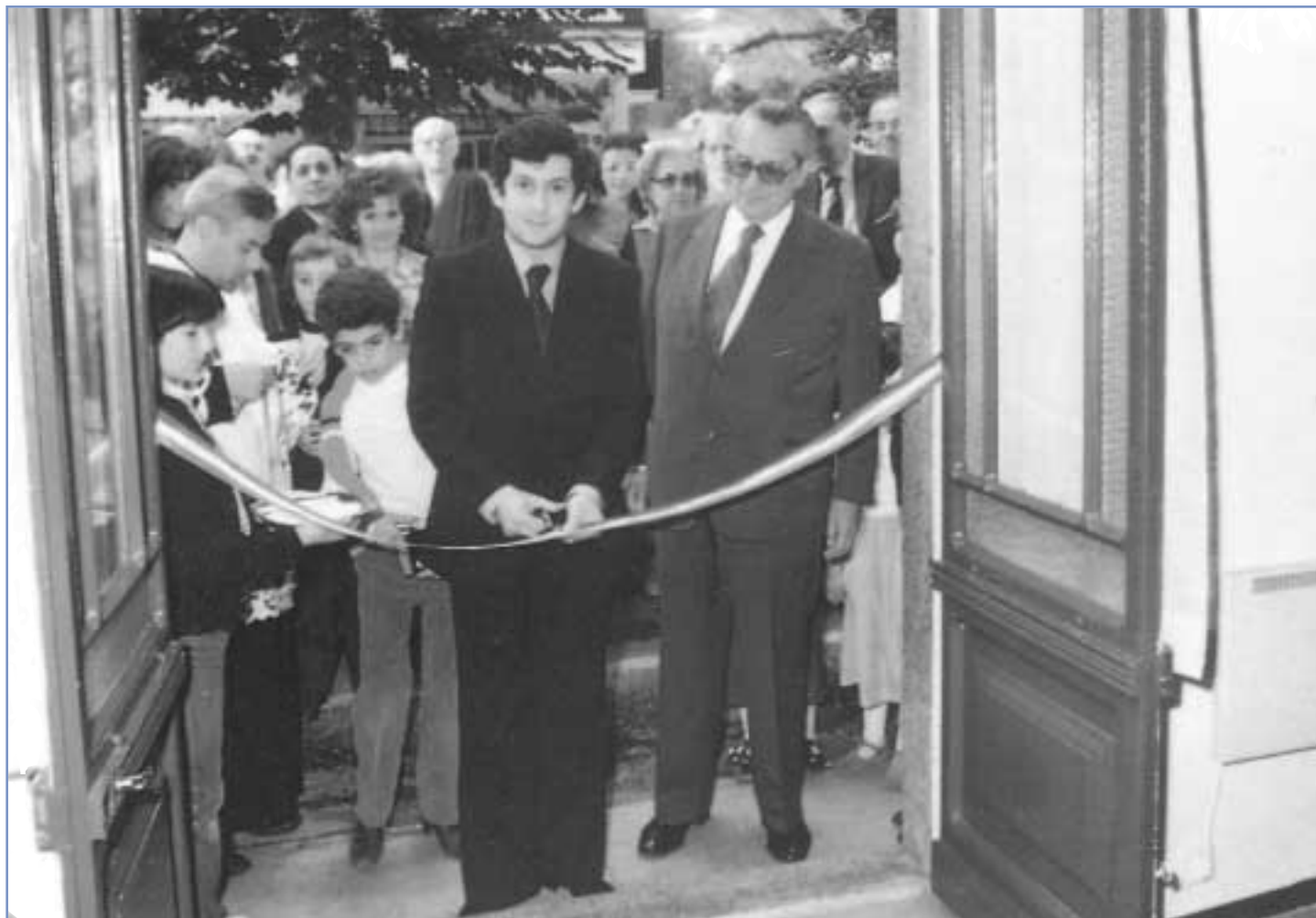
Inaugurazione della Biblioteca - 10.9.1981