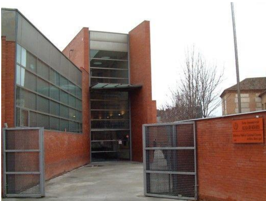
Foto 2: Ingresso all'Archivo Municipal e Biblioteca "Cardenal Cisneros"

Si tratta di un archivio pubblico con un patrimonio archivistico risalente al secolo XIII e che arriva sino ai tempi odierni. I documenti provengono da organi e istituzioni cittadine, dai Collegi dell'antica università complutense o dai protocolli notarili della Demarcación Notarial de Alcalá . Condivide l'edificio con la biblioteca municipale "Cardenal Cisneros", ha una sala con una trentina di posti disponibili e osserva un orario di apertura molto ampio (dal lunedì al venerdì, dalle 8.30 alle 21.00 e il sabato dalle 10.00 alle 14.00), lo stesso della biblioteca; l'accesso è consentito a tutti -previa presentazione di un documento di identità- e i documenti vengono immediatamente resi disponibili (gran parte del patrimonio è stata microfilmata e parzialmente digitalizzata) e se ne possono agevolmente ottenere fotocopie (non è possibile, invece, fare foto per proprio conto). I documenti da me consultati (secoli XVI e XVII) erano tuttavia residuali di un grave incendio occorso nella vecchia sede che ha distrutto parte dei fondi archivistici e quindi lo stato di conservazione presentava tracce di questo drammatico avvenimento.