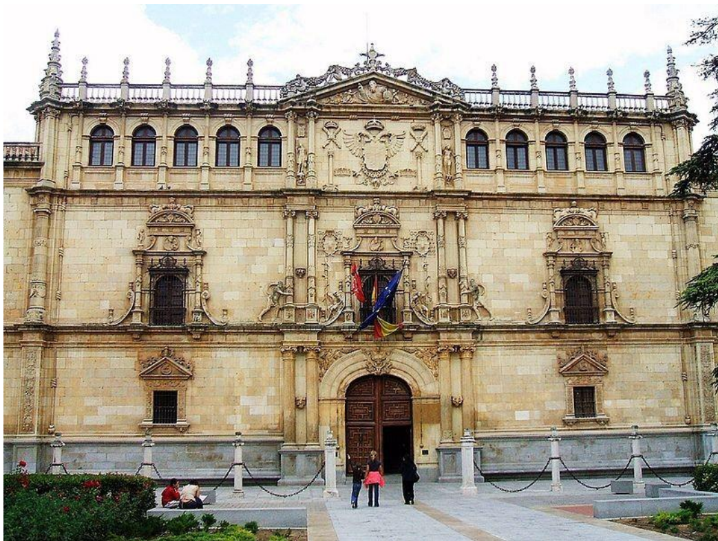
Foto 1: Colegio Mayor de San Ildefonso, Universidad de Alcalá de Henares

L' Archivo Municipal di Alcalá de Henares, appartiene a una cittadina molto speciale, poiché la storia della villa di Alcalá de Henares è lunga e gloriosa. Di fondazione celtibera, poi fiorente città di romana (Complutum), nel Medioevo, con l'arrivo degli arabi ("Alcalá" deriva dall'arabo القلعة [pron. al-qal'a ], ovvero "roccaforte"), il fiume Henares servì da linea di confine tra il dominio arabo e quello cristiano. Tuttavia, fu con l'inizio del XVI secolo che Alcalá assunse notorietà, quando il potente cardinale Francisco Jiménez de Cisneros (1436-1517) ottenne da papa Alessandro VI e dai "Re Cattolici" (di cui era confessore; inoltre, alla morte di Ferdinando II d'Aragona, fu reggente del trono di Spagna) l'autorizzazione a far sorgere in quel sito la prima città universitaria dell'Europa occidentale.