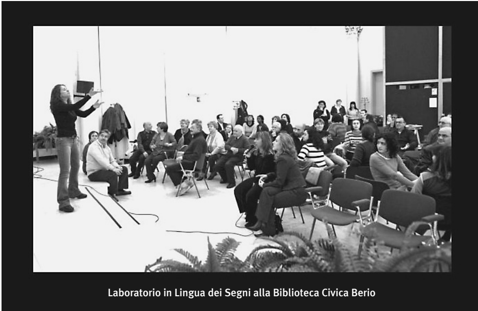
Laboratorio in Lingua dei Segni alla Biblioteca Civica Berio

ca 50 liste di discussione su diversi temi. Tramite i propri membri ufficiali, l'IFLA rappresenta (direttamente o indirettamente) 500.000 biblioteche e professionisti del settore in 150 paesi, circa 4.000 dei quali sono previsti giungere da tutto il mondo all'incontro milanese. Inutile dire che questo Congresso è un'occasione unica di confronto per le realtà bibliotecarie italiane rappresentate nei vari organi della struttura IFLA da ben 19 delegati AIB.