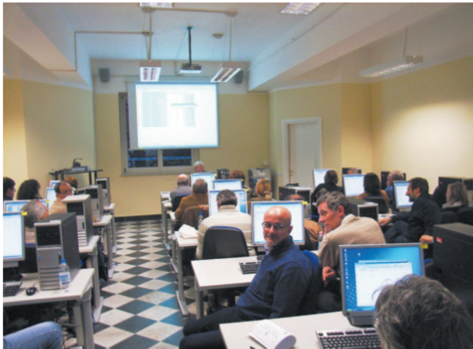
Momenti dal Corso ligure del progetto nazionale 2L lifelong learning

Da rimarcare che in tutto questo percorso, che alla fine coinvolgerà circa 500 dipendenti degli uffici periferici del MiBAC, è prevista la partecipazione attiva,