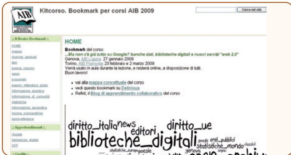
Pagina web del Kitcorso a cura di L. Testoni