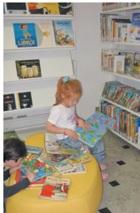
Amico Libro nella Sezione Ragazzi della Biblioteca Civica di Savona

(Centro sistema bibliotecario della Provincia di Genova).