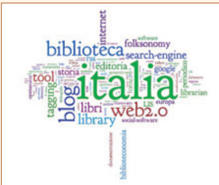
Tag cloud realizzata da Anna Osbat con i tag utilizzati in del.icio.us [http://delicious.com/aosbat]

I tag associati dall'utente ai propri contenuti possono essere rappresentati graficamente in una cosiddetta "nuvola", cioè in una lista pesata, in cui i termini più ricorrenti sono individuati dall'uso di un font maggiore. L'utilità dell'applicazione si associa proprio all'immediatezza della grafica, che rivela a colpo d'occhio le parole chiave della pagina web in cui ci si trova e, nello stesso tempo, quelle che hanno maggiore rilevanza. Cliccando sulla parola si accede direttamente a tutti i riferimenti etichettati dall'utente con quel tag, come in una sorta di "ricerca facilitata" o di indice per argomenti con cui è possibile navigare i contenuti anche in maniera alternativa rispetto alle categorie già presenti nel sito.