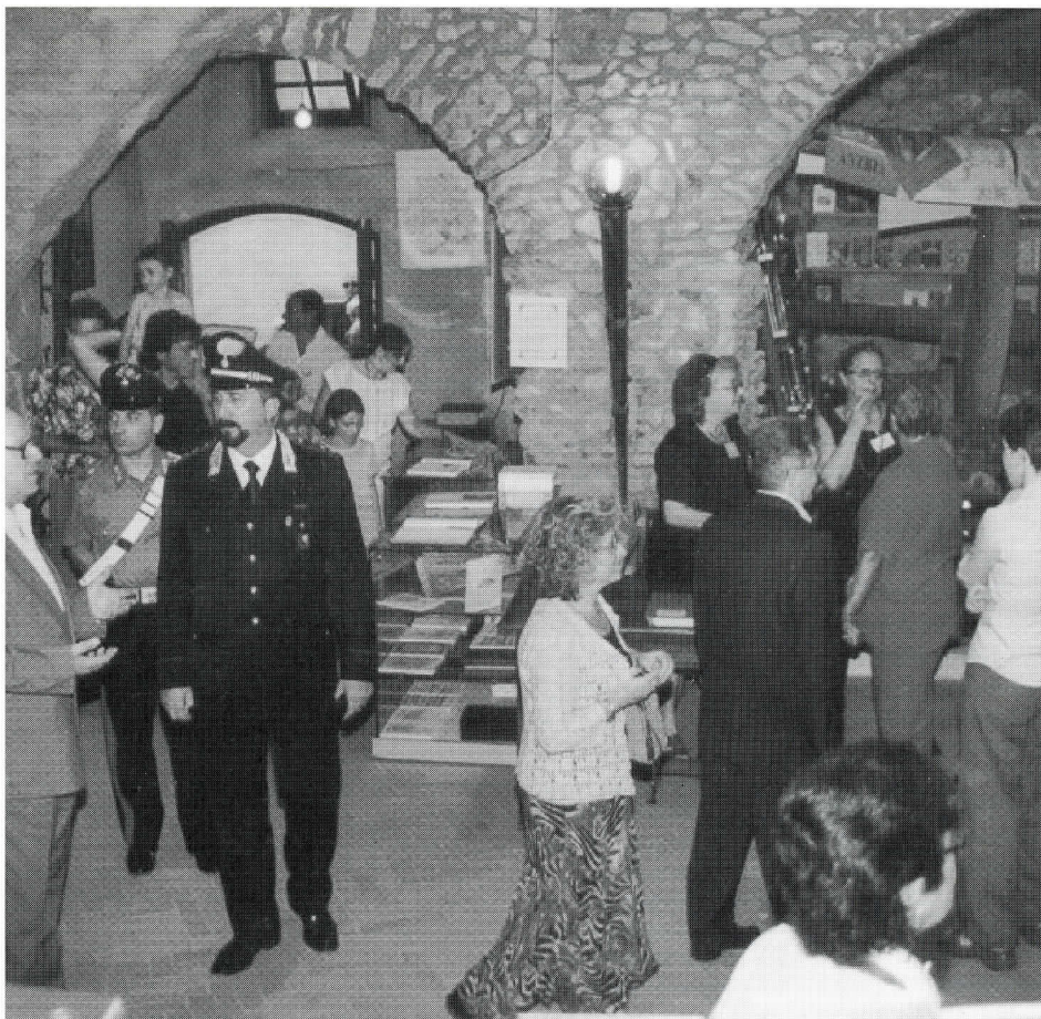
Un momento dell'inaugurazione della Rassegna

Con l'apertura di questa importante struttura, Peagna, che già è sede del Centro Studi Paleontologico legato al bacino del Torsero, con il Museo dei fossili, diviene uno dei più importanti poli culturali della Liguria per lo studio della storia regionale.