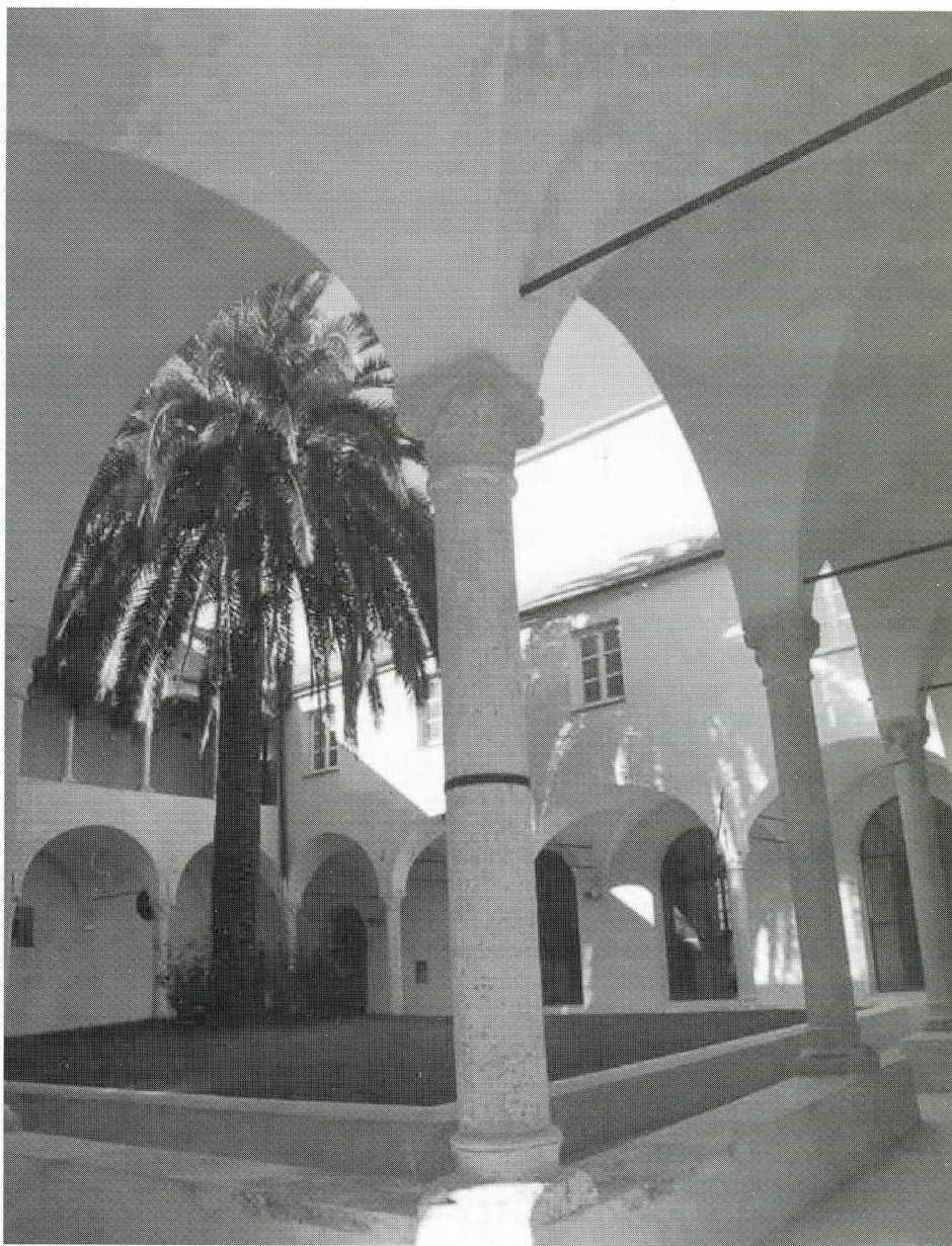
Il Chiostro su cui si affaccia la nuova biblioteca

Nella nuova sede, il pubblico, sempre in continua crescita, troverà nuovi servizi; sono state rafforzate le dotazioni multimediali: saranno a disposizione sei postazioni collegate ad Internet tramite ADSL, ed una sarà predisposta per l'elaborazione grafica; la sezione di consultazione potrà contare su circa 300 cd-rom; 600 cd-audio daranno vita alla nuova sezione musicale articolata in generi (classica, operistica, leggera, etnica, jazz) con la possibilità di ascolto e prestito; oltre 1000 VHS della sezione cinema e documentari saranno ammessi al prestito, mentre è in via