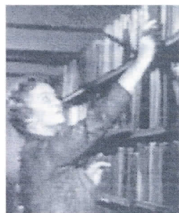
"Storm Center" ("Al centro dell'uragano") 1956 Alicia Hull (Bette Davis) ricollocata al suo posto il libro che le costerà il licenziamento.